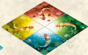
YOZUMI de Carpes