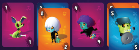
Příklad sbírky před hráčem

Nechte si místo pro balíček vytvořených hord.