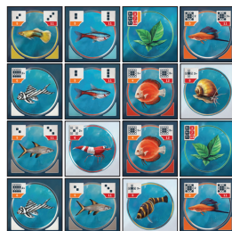
Akvárium každého hráče bude mít na konci hry 16 karet, uspořádaných do čtvercové plochy.

POZOR! V průběhu hry nelze umístěné karty v rámci vašeho akvária přemísťovat.