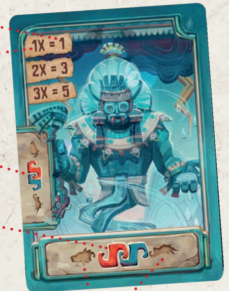
Darstellung der Ausrichtung des Cóatl

Die Reihenfolge der Teile, die zur Erfüllung der Karte notwendig ist