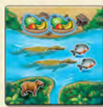
Речной квадрат с кайманами и пираньями

Также в игре есть 15 речных квадратов . Они тоже относятся к квадратам местности , но у них особое назначение.