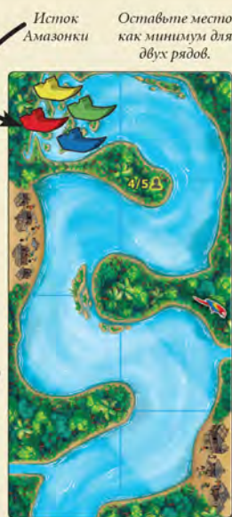
Участствуют жёлтые, зелёные, красные и синие фишки. Лодки игроков находятся у истока Амазонки.