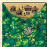
Квадрат с деревней и изображением животного в джунглях

Основные компоненты игры — 65 обычных квадратов местности , на которых изображены деревни и притоки реки. Вокруг расстилаются джунгли, где обитают дикие животные.