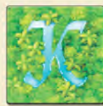
Оборот квадратов местности

Обратная сторона у всех квадратов (как обычных, так и речных) одинаковая.