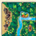
Квадрат с притоком и изображением фруктов

Также в игре есть 15 речных квадратов . Они тоже относятся к квадратам местности , но у них особое назначение.