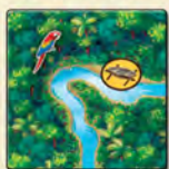
Квадрат с притоком и символом лодки