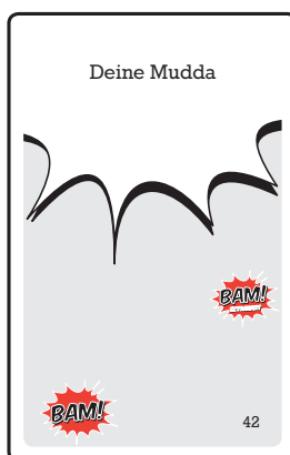
169 graue Begriffskarten