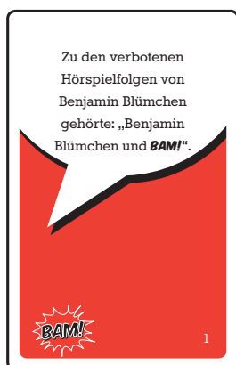
39 rote BAM! -Karten