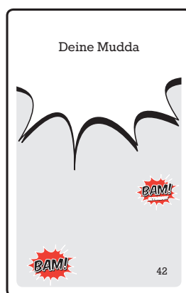
169 graue Begriffskarten