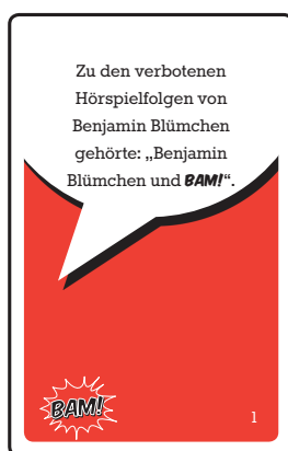
39 rote BAM! -Karten